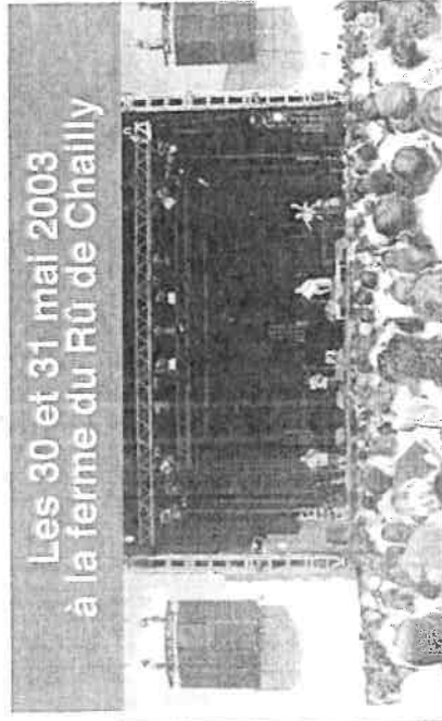
Spectacle sur la grande scène en 2002 - plus de 12 000 spectateurs sont venus à Fossoy : un village de 650 habitants « Un événement majeur pour le sud de l'Aisne ! »

Cette année : accès total sur le site aux personnes handicapées. Tarifs : 1 jour 22€ ou les 2 jours 30€ Pour les étudiants de -26 ans, chômeurs et RMistes 25€ les 2 jours. Gratuit pour les -12 ans.