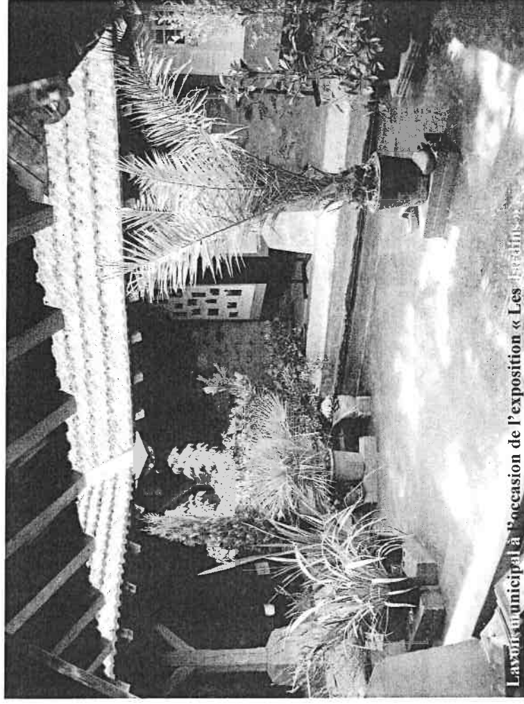
L'avis municipal à l'occasion de l'exposition « Les Tilleuls »