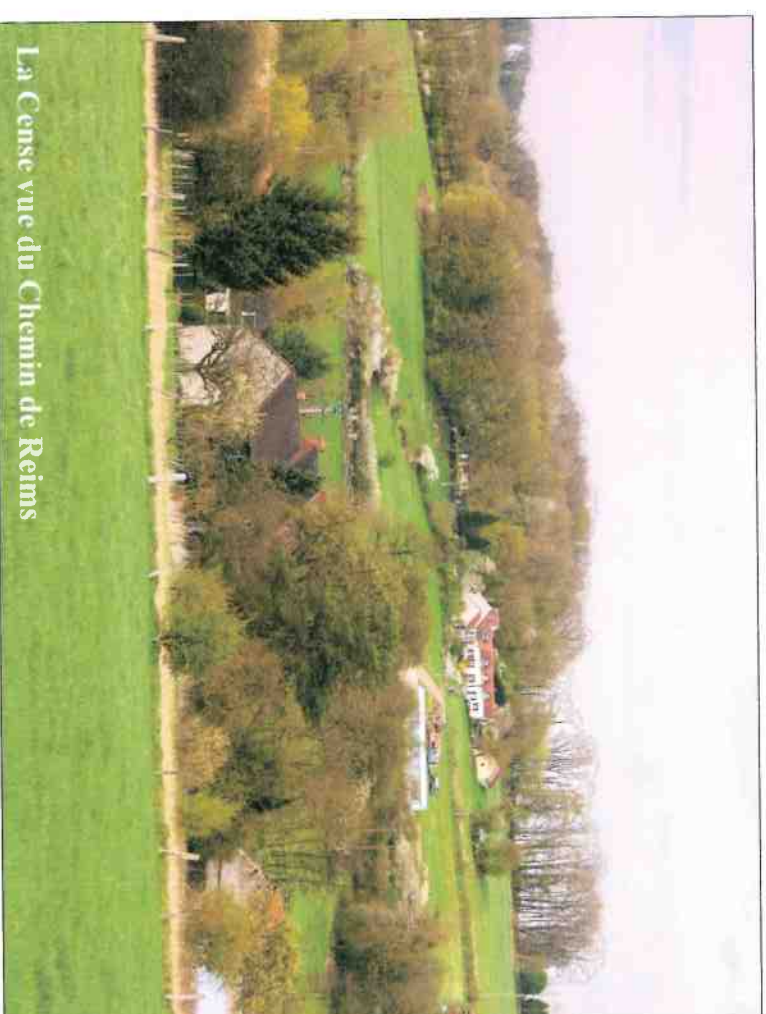
La Cense vue du Chemin de Reims