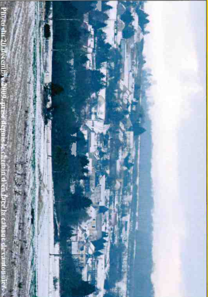
Photo du 20 décembre 2009, prise depuis le chemin d'en face la cabane de cantonnier.