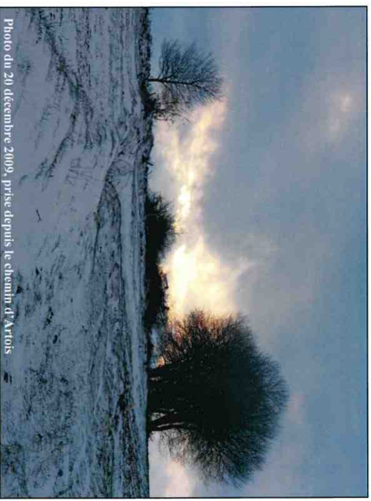
Photo du 20 décembre 2009, prise depuis le chemin d'Artois