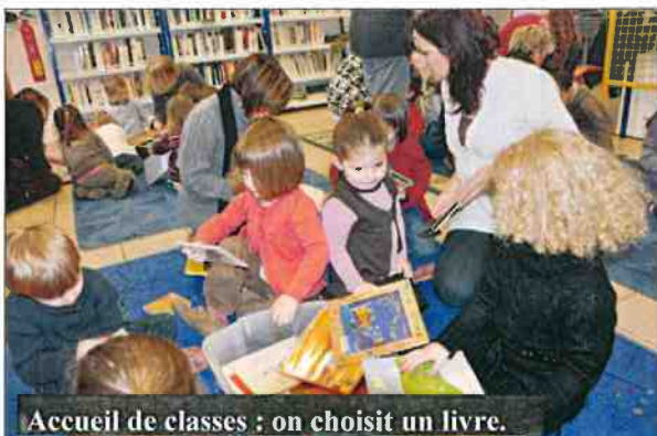
Accueil de classes : on choisit un livre.