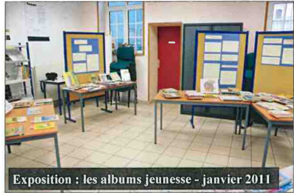
Exposition : les albums jeunesse - janvier 2011

Cet emploi a permis une bonne gestion de la médiathèque, le maintien des activités existantes et la mise en place de nouvelles.