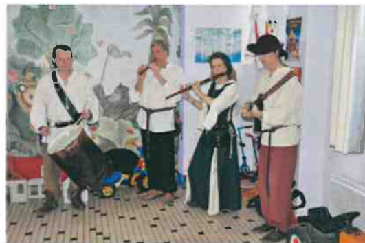
Danse, musique et instruments