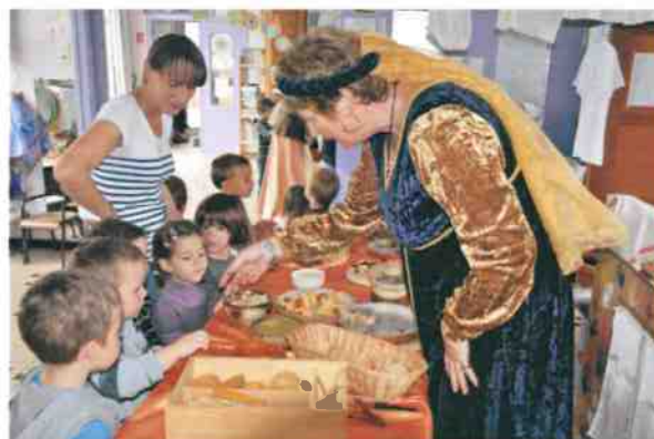
Cuisine, pâtisserie, arômes