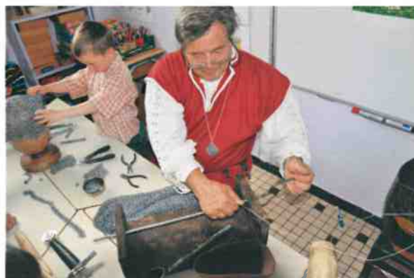
Cotte de mailles

Les ateliers ont été mis en place et animés par l'association « Au cœur d'un grimoire »