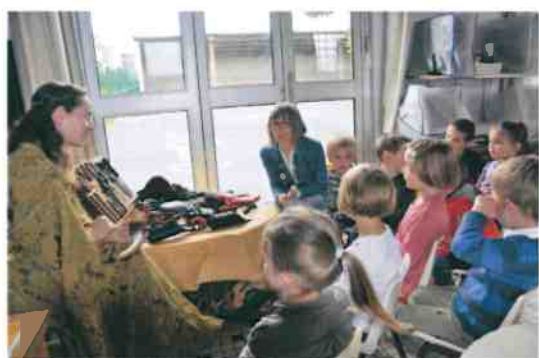
Travail du cuir