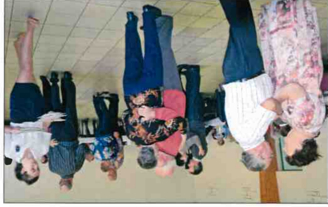
11 novembre 2014