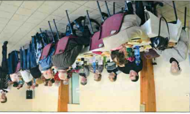
Les repas des Anciens