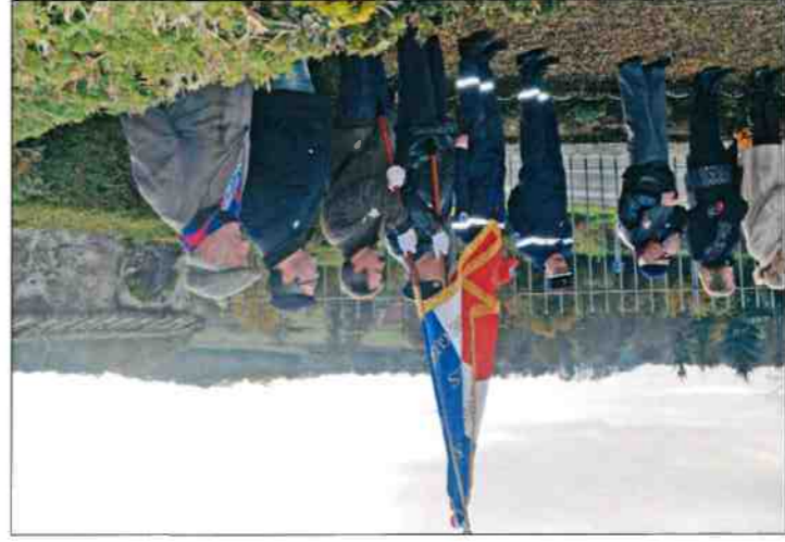
Anciens Combattants et porte-drapeau