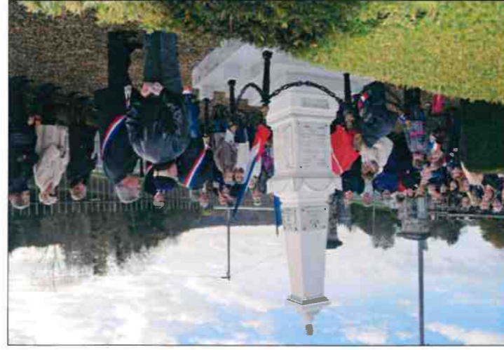
Appel aux Morts

Le maire est « président de droit des commissions. Il peut déléguer cette fonction et se faire représenter » (C.G.C.T, circulaire du 31/03/1992 : jurisprudence administrative). « ... le nombre des membres des commissions est fixé par le conseil, qui désigne ensuite les conseillers municipaux devant siéger dans chacune d'elles... » « ...elles peuvent être mises en place pour la durée du mandat municipal ou une durée moindre (renouvellement chaque année, par exemple)... » Le maire réunit, régulièrement, les présidents de commissions. Les présidents de commissions présentent leur rapport au maire et au conseil municipal. Les adjoints font partie intégrante de chacune des commissions. Ils sont systématiquement convoqués à chaque réunion.