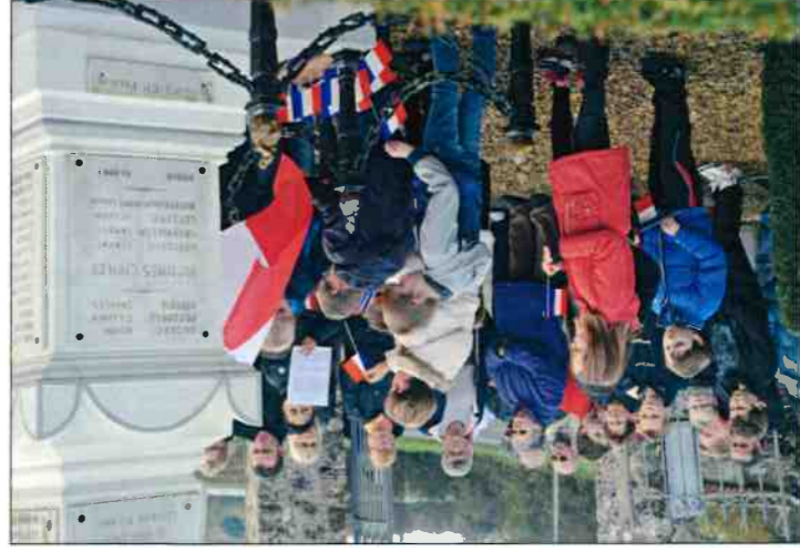
Participation des élèves de l'école de Beauvardes : lecture de Beauvardes : lecture de lettres de poilus, chant de la Marseillaise...