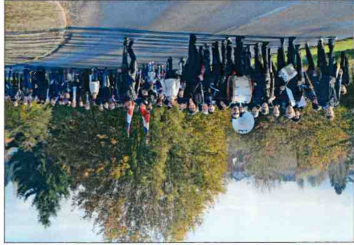
Défilé avec l'Union Musicale du Tardenois