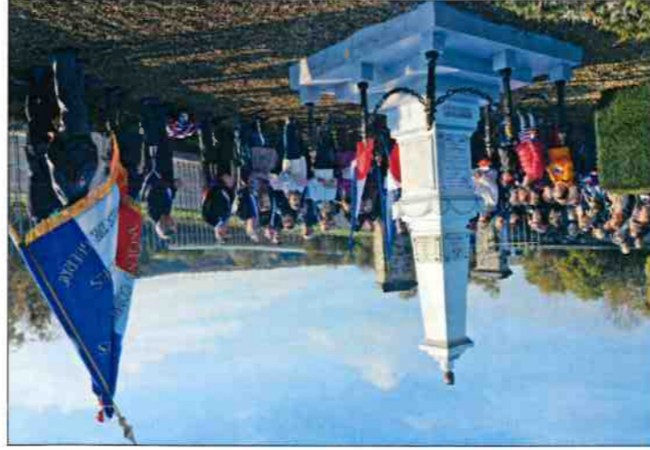
Rassemblement devant le monument