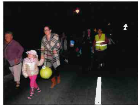
La retraite aux flambeaux