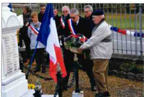
Le dépôt de la gerbe de fleurs