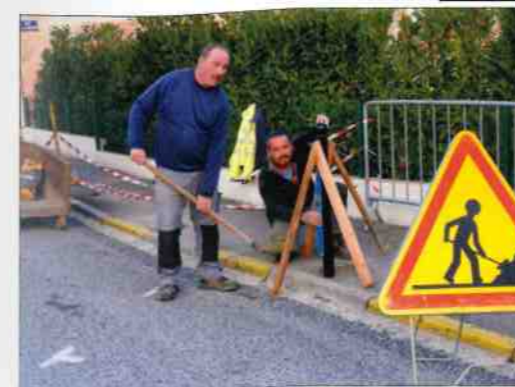
rue de la Harleine