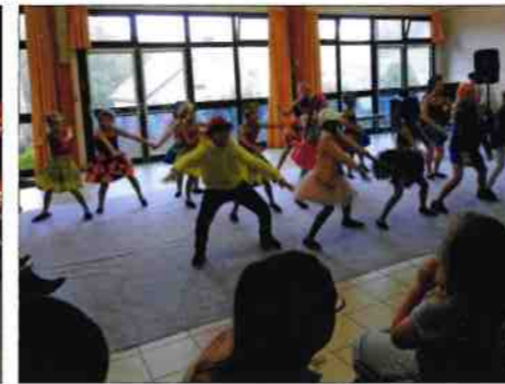
La prestation de Flash Dance