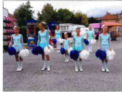
La prestation des Majorettes