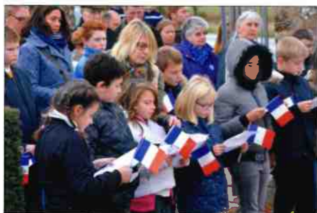
Lecture de la lettre des anciens combattants et chant de Florent Pagny "Le soldat" interprétés par les enfants des écoles