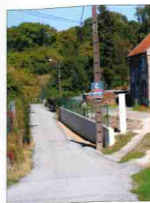
rue de la Grenouillère