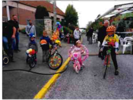
Les vélos fleuris