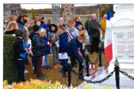
Pose d'un drapeau à chaque "mort pour la France"