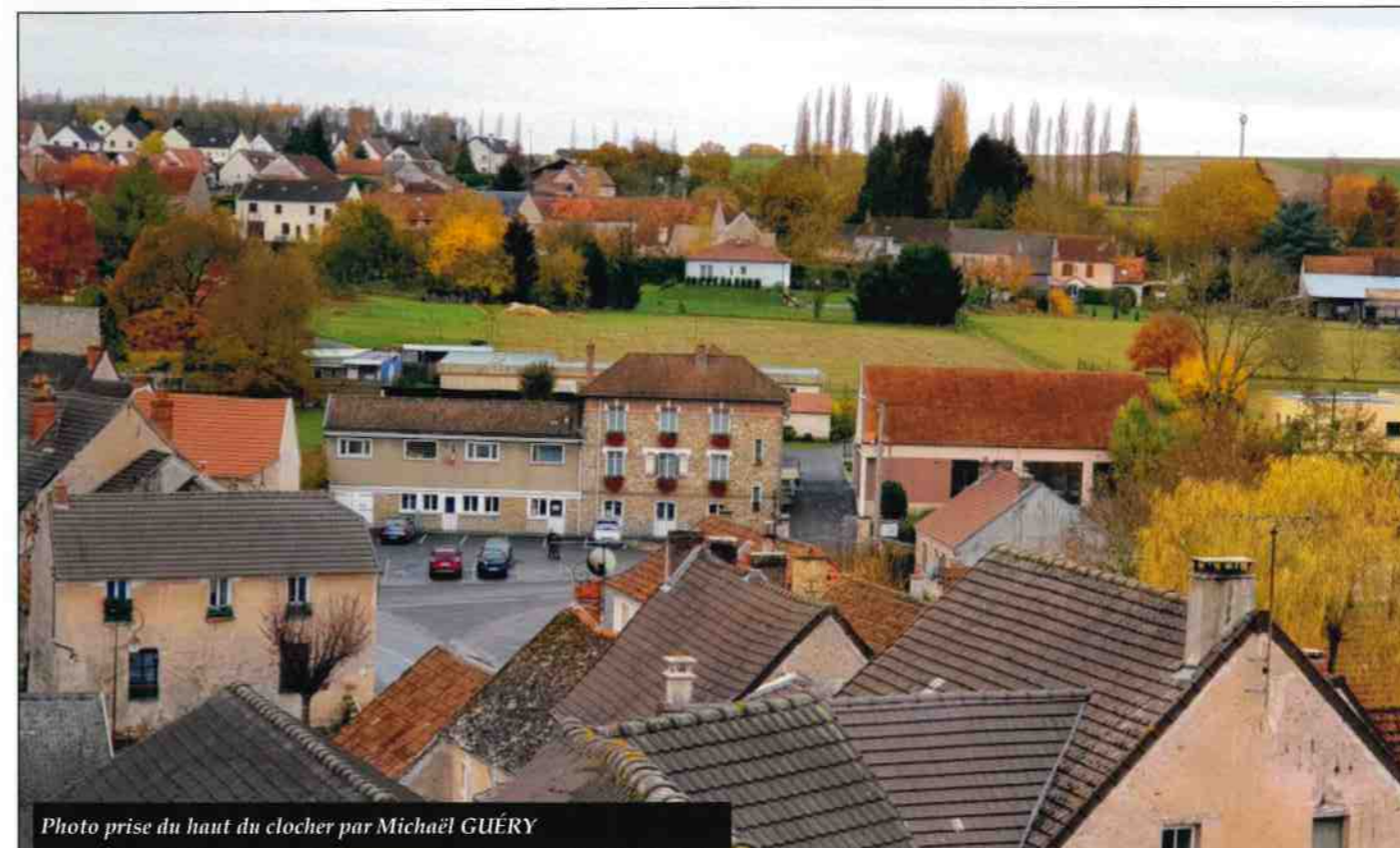
Photo prise du haut du clocher

Mairie de BEUVARDES Téléphone : 03 23 71 20 15 Fax : 03 23 71 44 01 mairie.beuvardes@wanadoo.fr