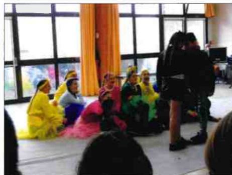
Le spectacle présenté par le groupe Flash Dance de Venizel.

À cause des conditions météorologiques, le spectacle s'est déroulé dans la salle communale