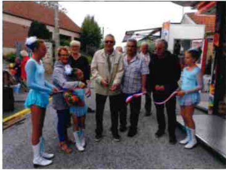
L'ouverture de la fête

Quelques photos des diverses animations lors de la fête communale 2018 du samedi 22 et dimanche 23 septembre