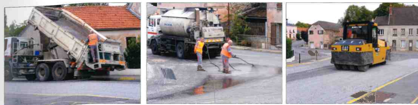
rue de la Harleine