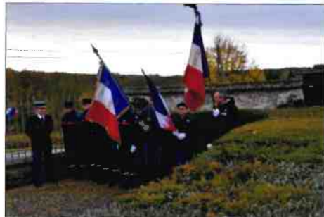
Les porte-drapeaux et les pompiers